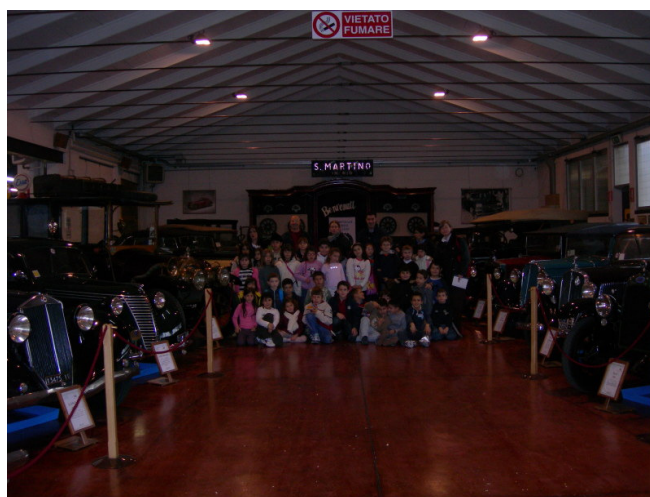
Scuola Elementare di Brescello – classe 3°

Quasi 5000 sono i visitatori che a fine anno verranno a visitare il Museo. A tal proposito segnaliamo una bella iniziativa. In collaborazione con Aci di Reggio Emilia e il distretto scolastico, abbiamo indetto un concorso riservato alle scuole di primo e secondo grado, redatto da Carla, con l'obiettivo di portare classi scolastiche in visita al Museo ed in seguito a tale visita le classi o le scuole dovranno svolgere un lavoro scritto o espressivo. I migliori lavori saranno premiati a fine anno scolastico con premi destinati alle scuole. L'elenco è ancora in formazione, ma si tratterà di materiale elettronico di supporto, che spesso è carente nelle scuole (PC, multimediali etc.). Se qualcuno volesse provvedere a completare il monte premi, sarà ben accetto. Già 4 sono gli appuntamenti per il mese di Novembre.